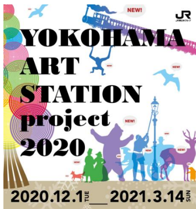
YOKOHAMA ART STATION project 2020 キービジュアル

YOKOHAMA Station Cityでは今後も、『YOKOHAMA ART STATION project 2020』の様な多くの方にお楽しみいただけるイベントの企画・開催を通じてエリアの魅力発信と価値の向上に取り組んでまいります。