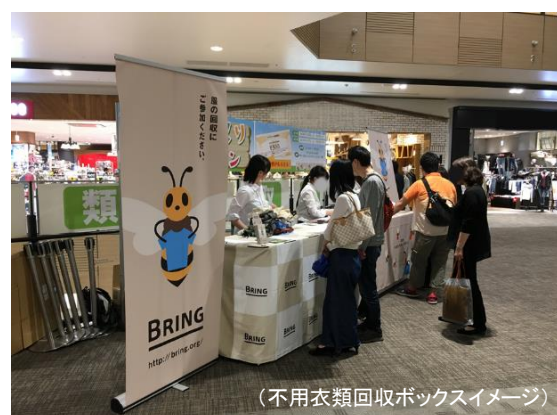
(不用衣類回収ボックスイメージ)

※1: お一人さま最大2着までお持ち込み可(クーポンはお一人さま最大2枚までの配布)。