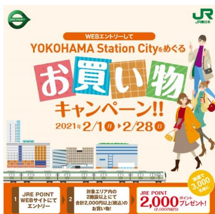
「YOKOHAMA Station City をめぐるお買い物キャンペーン!!」 キービジュアル

YOKOHAMA Station City では今後も、多くの方にお楽しみいただけるイベントの企画・開催を通じてエリアの魅力発信と価値の向上に取り組んでまいります。