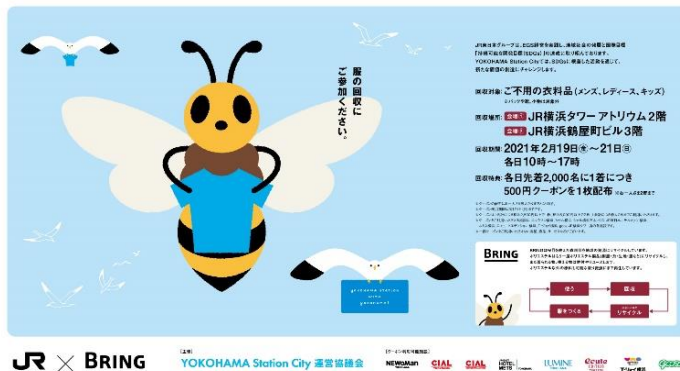
不用衣類の回収キャンペーン キービジュアル

また、不用衣類と引き換えに進呈したクーポンを YOKOHAMA Station City 内の施設でご利用いただくことで、多くのお客さまにエリアの魅力に触れていただきたいと考えております。