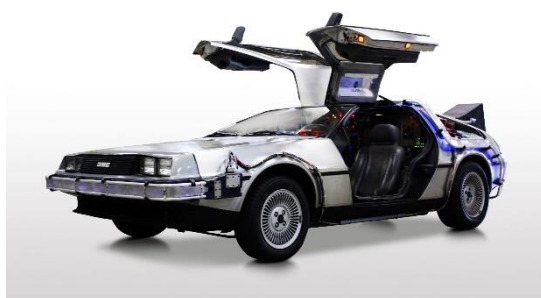
古着から作ったバイオ燃料で走ったデロリアン