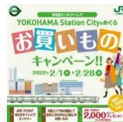
キャンペーン キービジュアル

② 対象エリア内の施設(駅ビル、駅構内店舗等)にて合計 2,000 円以上(税込)のお買いもの(サービス利用含む)をしていただきます。