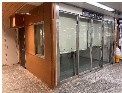
JR 横浜駅中央通路「YOKOHAMA SEEDS」

※イベントは予告なく変更・終了する場合がございます。あらかじめご了承ください。 ※お出掛けの際は、新型コロナウイルス感染症対策を行ったうえで、お出掛けください。