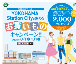
キャンペーン キービジュアルイメージ

・キャンペーンページ URL: https://www.jrepoint.jp/campaign/0061000443/