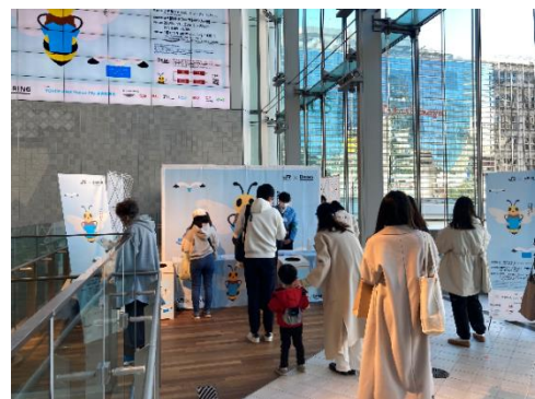
不用衣類の回収キャンペーン 過去の様子

※1: お一人さま最大 2 着までお持ち込み可(クーポンはお一人さま最大 2 枚までの配布)。