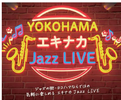
「YOKOHAMA エキナカ Jazz LIVE」キービジュアル

なお、2024年3月23日(土)・24日(日)にも、JR横浜タワー12F 屋上広場 うみそらデッキにて「YOKOHAMA うみそら Jazz LIVE Vol.3」を実施予定です。YOKOHAMA Station City で素敵なひとときをお過ごしください。