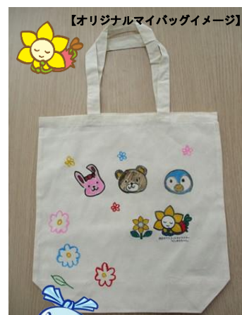
【オリジナルマイバッグイメージ】