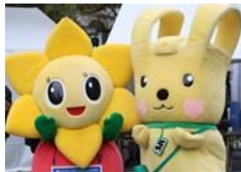
西区マスコットキャラクター「にしまろちゃん」