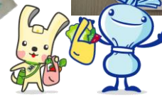
【マルチケースイメージ】