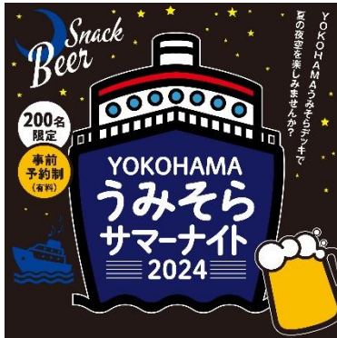
「YOKOHAMA うみそらサマーナイト」キービジュアル

本イベントを通じ、多くのお客さまに YOKOHAMA Station City や横浜エリアの魅力に触れていただきたいと考えております。是非 JR 横浜タワー内でお弁当やお飲み物等お買い物のうえ、お越しください。