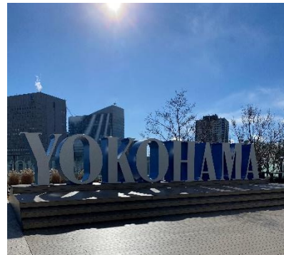
JR 横浜タワー12F うみそらデッキ

※本イベントは、時間予約・定員制のイベントです。ご参加には事前のご予約が必要です。