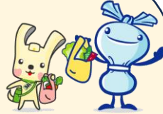
横浜市資源循環局マスコット イーオ・ミーオ