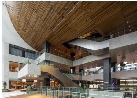
JR横浜タワー アトリウム (JR横浜駅西口)

【食品ロス啓発ポスターをつくらう 専用予約ページ】 ※予約開始 5/22(木) 18:00～ https://waste-no-food-workshop.peatix.com (特定非営利活動法人EduArt)