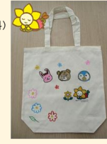
【オリジナルマイバッグイメージ】