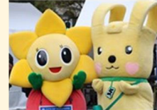
西区のマスコットキャラクター 「にしもちちゃん」 横浜市資源循環局マスコット イーオ