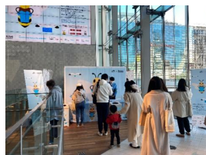
不用衣類の回収キャンペーン 過去の様子