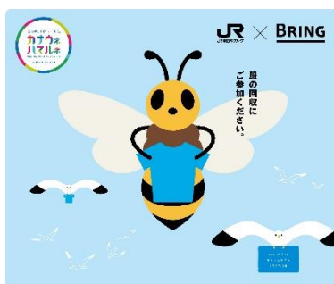
不用衣類の回収キャンペーン キービジュアル

また、YOKOHAMA Station City では、Suica をタッチするだけで参加でき、近隣施設のクーポン券などが当たる Suica タッチ抽選会も実施予定です。(詳細は後日 YOKOHAMA Station City 公式HPにてお知らせいたします)。YOKOHAMA Station City で素敵なひとときをお過ごしください。